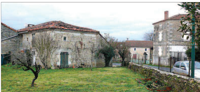
Un passage piéton sera créé dans le jardin de la maison Pasquet le long du muret pour pallier la largeur insuffisante de la rue.